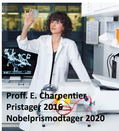
Proff. E. Charpentier Pristager 2016 Nobelprismodtager 2020