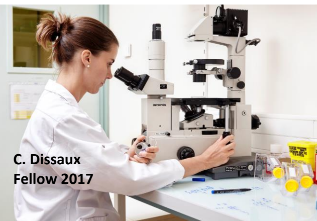
C. Dissaux Fellow 2017

Nærmere betingelser fremgår af opslaget på www.forwomeninscience.com